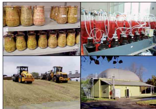
Silier- und Biogasversuche im Labormaßstab (oben) und in der Praxis (unten)

Im Rahmen von großtechnischen Anbau-, Silier- und Biogasversuchen wird für ausgewählte Untersuchungsschwerpunkte die Übertragbarkeit der Laborergebnisse auf die Praxis geprüft. Um Handlungsempfehlungen für die Landwirtschaft ableiten zu können ist eine zusätzliche Analyse der betrieblichen Praxis bei Silageerzeugung und -management geplant.